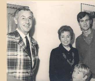
Guadalmina ha tenido una gran vida social en sus 50 años de existencia.